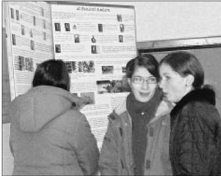
Az előadás szünetében a diákok a Darwinról szóló kiállítást szemlélik

1858-ban Alfred Russel Wallace öserdőkutató felveszi a már sikeresnek számító Dar-