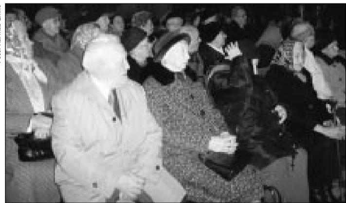
Mint elhangzott: mindenki tegye meg a tőle telhetőt a bajok enyhítésére

püspöki szentmisén ünnepelték a világnapot. Amint azt Nm. és Ft.Schönberger Jenő megyéspüspök szöszéki prédikációjából megtudhatták a jelenlévők, a világnap célja az, hogy Isten nepe kellő figyelmet szenteljen a betegeknek és a szenvedőknek, a 2009-es esztendőben a szenvedő gyermekekért kell különösképp imádkozni.